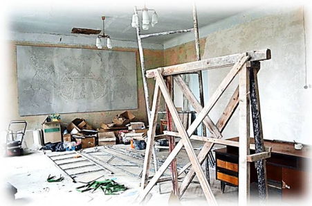
Актовий зал за попередньої влади