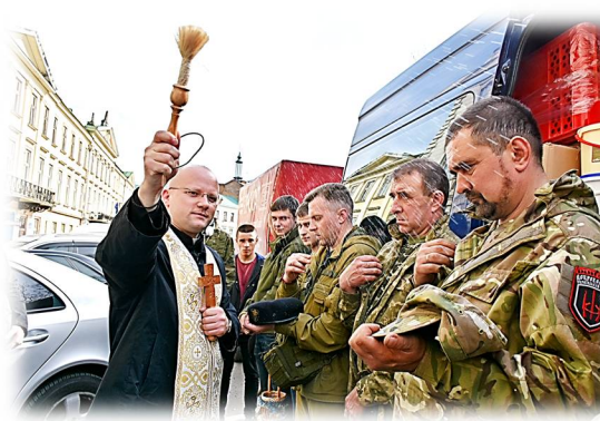
Бібрський міський голова вирушив у чергову волонтерську поїздку в зону бойових дій

стопаді 1941 р. Перебування в таборах у Чутуєві й Харкові завершилося щасливо - його знання німецької та легенда, яку він придумав, дали змогу обдурити і німців - його звільнили з полону якраз перед католицьким Різдвам. З трудом і пригодами через Підволочиськ дістався до Львова, а з нього знову, як 1941 - до рідного Романова. «Так почався календарний Новий рік 1942 - ий», — зафіксує у спогадах О.Горбач.