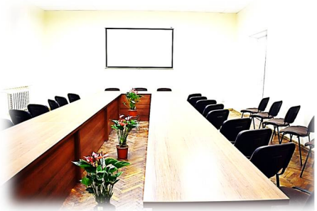
Актовий зал після ремонту. Початок 2017 р.