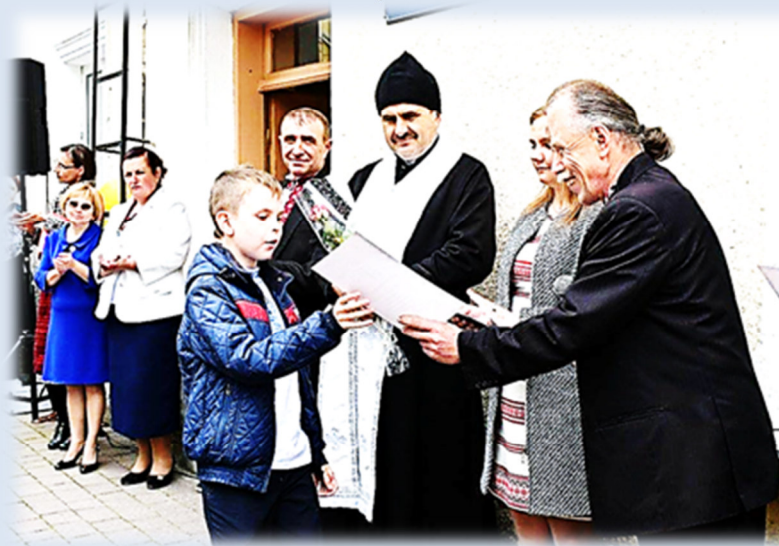
Свято останнього дзвоника в Бібрській музичній школі