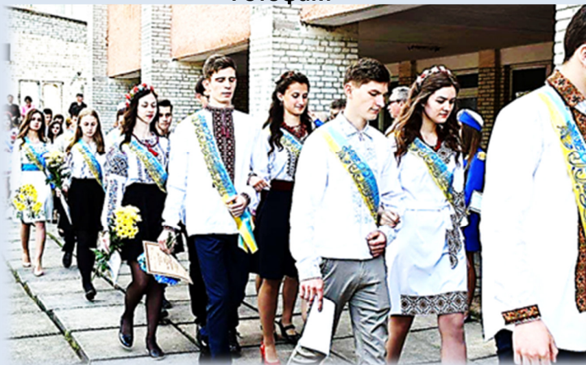
Свято останнього дзвоника в Бібрській ЗОШ