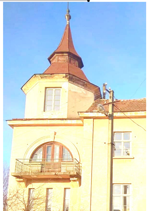
БФ Спадщина.UA / Heritage.UA