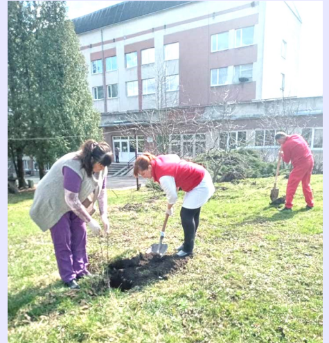
Бібрська міська лікарня