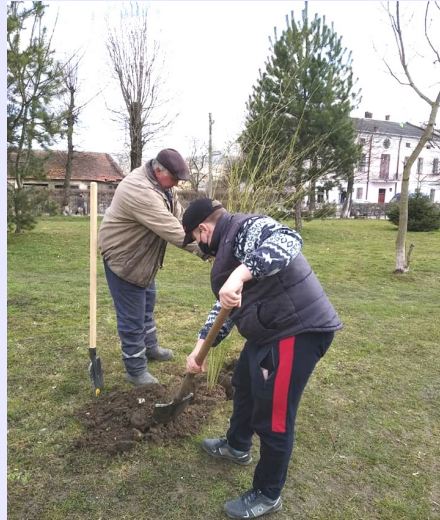
КП «Рідне місто»