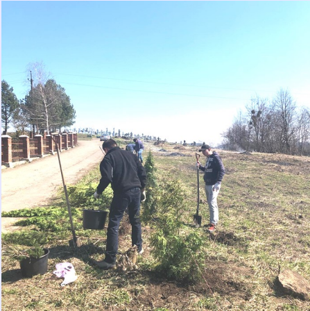
Мешканці с. Під'ярків