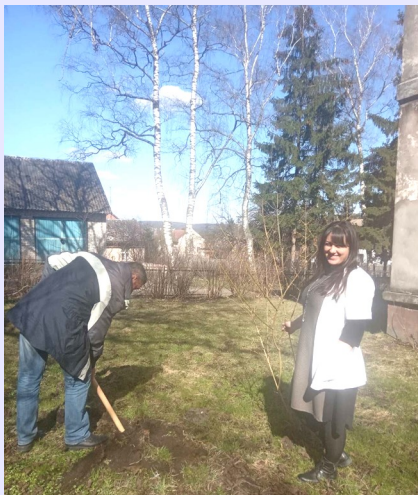
Центр первинної медико-санітарної допомоги